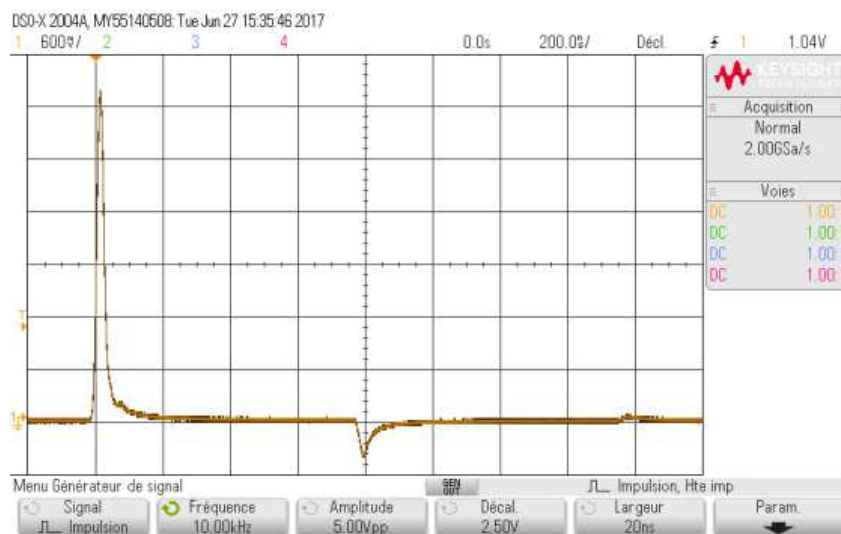
FIGURE 2 – Oscillogramme de la propagation d'une impulsion dans un câble unique

On peut voir sur l'écran de l'oscilloscope l'impulsion lorsqu'elle parvient sur la voie d'entrée 1 de l'oscilloscope alors qu'elle a parcouru tout le câble. Par contre, on peut être surpris de voir une petite impulsion apparaître \Delta t \simeq 800 ns plus tard. Cette impulsion s'explique par le fait que l'impédance d'entrée d'une voie de l'oscilloscope est d'environ Z_e \simeq 1 \text{ M}\Omega et que l'impédance du câble est Z_c = 75 \Omega . Comme il n'y a pas adaptation d'impédance, une petite partie de l'impulsion incidente se réfléchit sur l'entrée 1 et repart en arrière pour parcourir à nouveau tout le câble. Et ce n'est pas fini... En effet, lorsqu'elle arrive au niveau de la sortie du générateur, le même problème d'impédances différentes se pose. Il y a donc réflexion, la petite impulsion repart et revient sur la voie 1 pour être enregistrée environ 800 ns après la grande impulsion. Il se produit encore une réflexion mais l'impulsion résiduelle est à peine perceptible environ 1 600 ns après la détection de l'impulsion initiale. Toute cela se voit mieux sur l'enregistrement de l'oscillogramme de la figure 2.