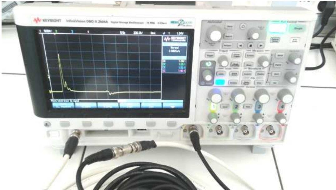
FIGURE 3 – Propagation d'une impulsion dans un enchaînement de deux câbles

On ajoute au bout du câble d'impédance Z_c = 75 \Omega , un petit câble noir de longueur \ell' = 5 \text{ m} et d'impédance Z'_c = 50 \Omega . Ce changement d'impédance correspond à un changement des caractéristiques du milieu de propagation de l'onde électromagnétique, c'est comme si, en optique, on passait par exemple de l'air à l'eau ou au verre. Au moment où l'impulsion arrive à l'interface des deux milieux, il se produit à la fois de la transmission et de la réflexion. De la même façon que dans la partie précédente, lorsqu'une impulsion arrive sur l'entrée 1 de l'oscilloscope, une partie va se réfléchir et repartir en arrière dans le câble de 50 \Omega pendant 5 \text{ m} tout d'abord, puis elle arrive à l'interface avec le câble de 75 \Omega , il se produit alors réflexion et transmission. Ce sont ces réflexions et transmissions qui expliquent les petites impulsions supplémentaires par rapport au cas du câble coaxial unique. Ces constatations sont visibles sur les figures 3 et 4.