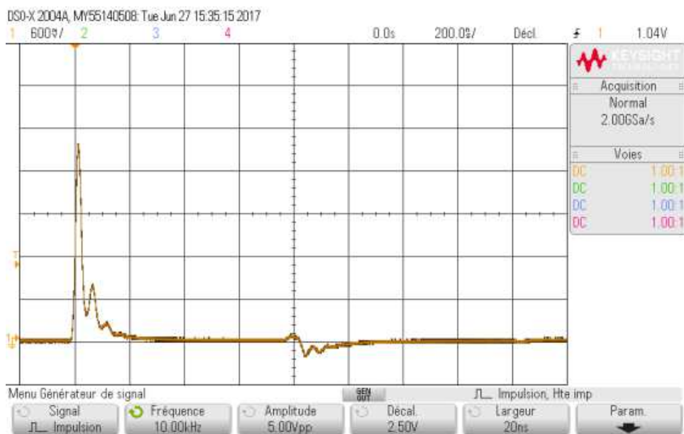
FIGURE 4 – Oscillogramme de la propagation d'une impulsion dans un enchaînement de deux câbles